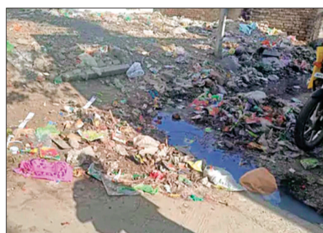
जहां भी नाले और नालीया चौक है साफ किया जाएगा। पीएम आवास कॉलोनी वार्ड 16 में ही है।