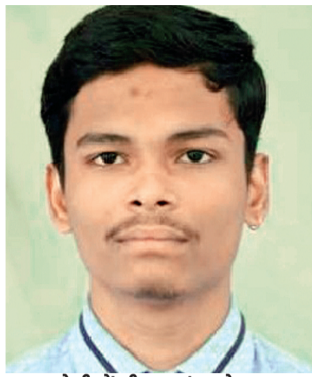
प्रथम श्रेणी में भी छात्राएं आगे 10वीं के बोर्ड परीक्षा परिणाम में कुल 8854 छात्र एवं 8411

छात्रों का पंजीयन हुआ था जिसमें 3307 छात्र एवं 3910 छात्राओं ने प्रथम श्रेणी अर्जित की। वहीं 12वीं में कुल 6130 छात्रों का एवं 6002 छात्राओं का पंजीयन हुआ था जिसमें 2555 छात्रों का तुलना में 3130 छात्राओं ने प्रथम श्रेणी प्राप्त कर स्कूल व जिले का नाम रोशन किया है।