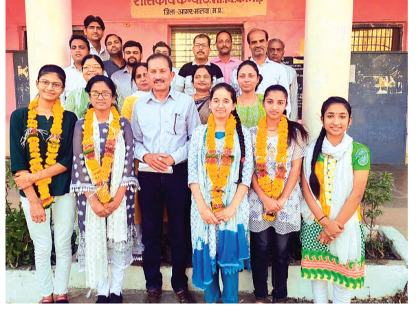
हरिभूमि न्यूज़ | कानड़

माध्यमिक शिक्षा मंडल द्वारा 10वीं और 12वीं का परिणाम घोषित किया गया। परीक्षाफल देखकर छात्र-छात्राओं के चेहरे खिल गए। परीक्षा परिणाम आने पर अपने-अपने विद्यालय पहुंचे छात्र-छात्राओं ने शिक्षकों के साथ मिलकर खुशियां मनाई। छात्रों ने एक दूसरे को मिठाई खिलाकर रिजल्ट की बधाई दी साथ ही शिक्षकों ने भी छात्र-छात्राओं का हौसला बढ़ाया और सफलता की बधाई देते हुए उनके उज्ज्वल भविष्य की कामना की।