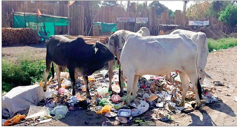
कॉलोनी में कचरा वाहन भी नहीं आता है, जिससे लोग परेशान हैं।

नगर के कन्नौद मार्ग के दोनों ओर के नाले भी चौक हैं। इनमें कचरा और मलबा भरा है। कॉलोनी चौराहा से भोपाल नाला तक मार्ग के दोनों ओर के नाले में मलबा भरा पड़ा है। स्थानीय नागरिकों ने नालों की सफाई की मांग की है। ऐसा ही कुछ हाल पुराना भोपाल-इंदौर मार्ग के पुराना बस स्टैंड से लेकर दरगाह तक हाईवे के दोनों बने नाले चौक हैं। कचरे के बड़े-बड़े ढेर लगे हुए हैं। करीब 4 वर्ष पहले शासन ने दरगाह के पास पीएम आवास कॉलोनी बनाई थी। फिलहाल यहां पर 300 से अधिक लोग रह रहे हैं। लेकिन 4 साल बाद भी यहां पर सफाई कर्मा नियुक्त नहीं हो सके। नालिया चौक हैं।